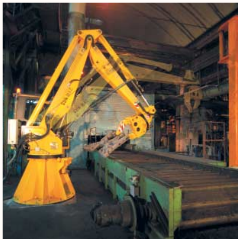
Applicazione in fonderia: recupero ed impilaggio di fusioni da kg 750.

La postazione di comando, è costituita da una cabina, la quale può essere dotata di aria condizionata, studiata per dare il massimo comfort all'operatore, massima visibilità e sicurezza. Un sedile ammortizzato con sensore "presenza uomo" che disabilita tutti i comandi in assenza dello stesso, garantendo un elevato livello di sicurezza. Inoltre, sul quadro di comando, è presente una pulsantiera con i principali comandi tra cui i pulsanti marcia-arresto di emergenza.